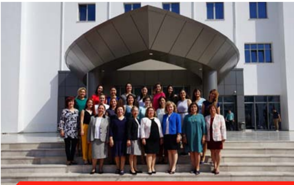
Yakın Doğu Üniversitesi'nde, Yükseköğretim Planlama, Denetleme, Akreditasyon ve Koordinasyon Kurulu (YÖDAK) ve Yükseköğretim Kurulu Başkanlığı'nın (YÖK) onayı ile Kuzey Kıbrıs Türk Cumhuriyeti'nin ilk Hemşirelik Fakültesi kuruldu. Yakın Doğu Üniversitesi kurulan fakülte ile Kuzey Kıbrıs Türk Cumhuriyeti'nde lisans, yüksek lisans ve doktora düzeyinde hemşirelik eğitimi veren ilk eğitim kurumu olma özelliğini taşıyor.

Tarihçesi köklü bir geçmişe dayanan Hemşirelik eğitiminin temelleri 1973 yılında atıldı. Sırası ile; Sağlık Bakanlığı bünyesinde 1973-1990 yıllarında ortaokul sonrası 2 yıllık, "Hasta Bakıcılık ve Ebelik Okulu", 1985-1989 yılları arasında mevcut yasa altında lise sonrası 3 yıllık eğitimle "Hasta Bakıcılık ve Ebelik Okulu" 1990 yılında değiştirilmiş adıyla "Hemşirelik ve Ebelik Okulu", 1994 yılında ise lise sonrası 2 yıllık önlisans eğitimi ile "Hemşirelik Meslek Yüksekokulu" oluşturuldu. Kuzey Kıbrıs Türk Cumhuriyeti Sağlık Bakanlığı Hemşirelik Meslek Yüksekokulu eğitimini, Sağlık Bakanlığı ve Yakın Doğu Üniversitesi arasında 2004 yılında imzalanan protokol çerçevesinde Yakın Doğu Üniversitesi'nin fiziksel, sosyal ve akademik desteğinden yararlanarak 2006 yılına kadar sürdürdü. 2006-2007 Eğitim-Öğretim yılında yapılan ek bir protokolle, YÖDAK'ın yaptığı merkezi sınavla