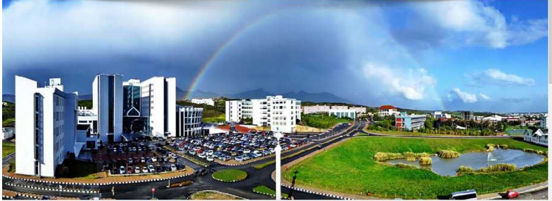
Hayvan Deneyleri Etik Kurulu Yönergesi

Sayfadaki başvurular'a tıklanarak başvuru için gerekli belgelere ulaşılır