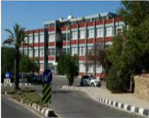
Fen Bilimleri Etik Komisyonu