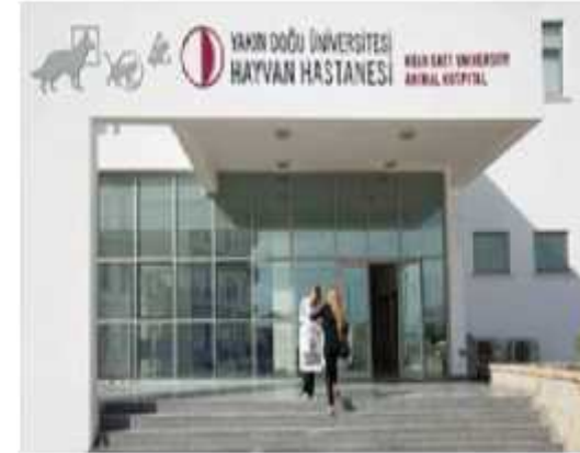
Hayvan Deneyleri Yerel Etik Kurulu